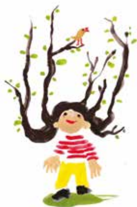
immagine di copertina La soddisfazione di Scarabisso

MER 13, GIO 14 MAR ore 10 TPO LA CASA DEL PANDA